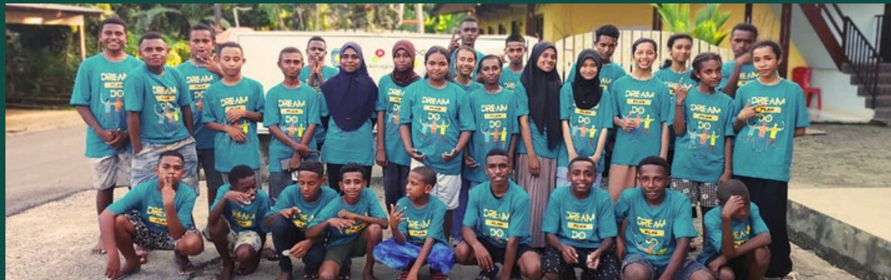
PROGRAM ENGLISH BOOTCAMP SISWA-SISWI TINGKAT SMP TANAH MERAH BARU, TAROI, ARANDAI, WERIAGAR DAN KOKAS