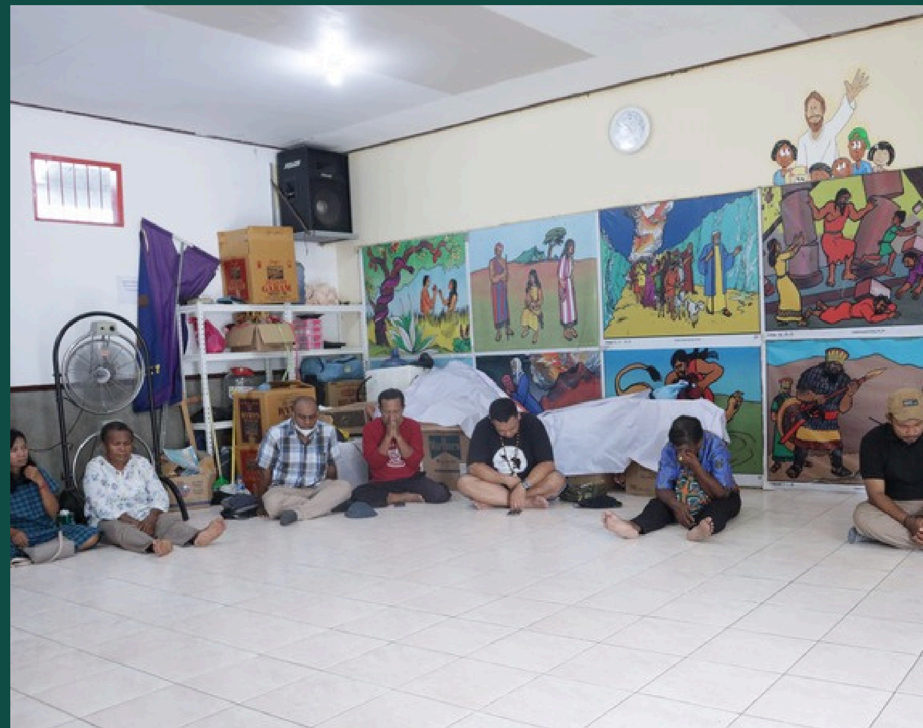
PROGRAM PENINGKATAN MINAT BACA ANAK LEWAT READING CORNER 2022