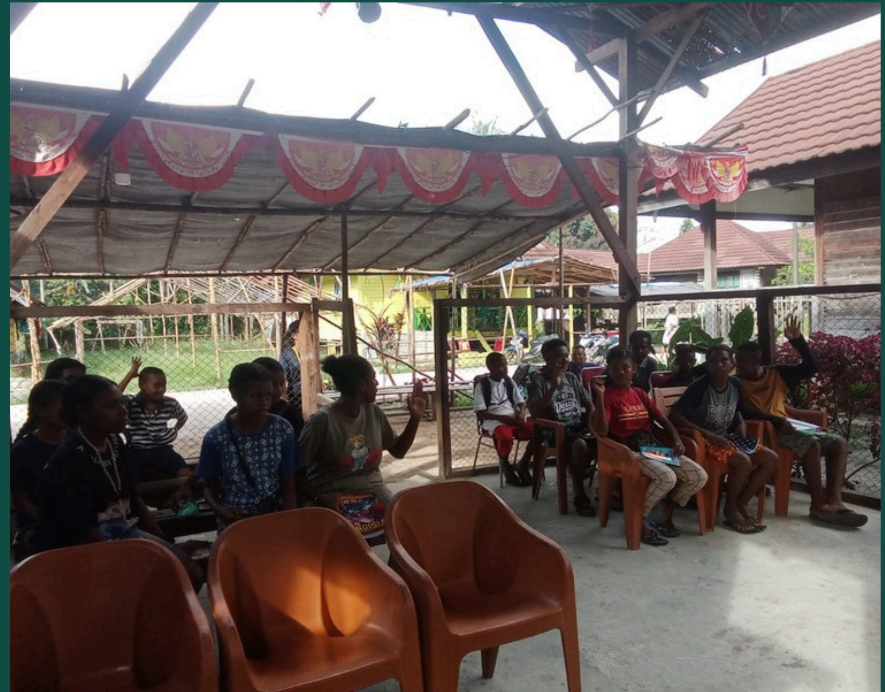
PROGRAM ENGLISH INTENSIVE COURSE DI TANAH MERAH BARU, TAROI, ARANDAI, WERIAGAR DAN KOKAS