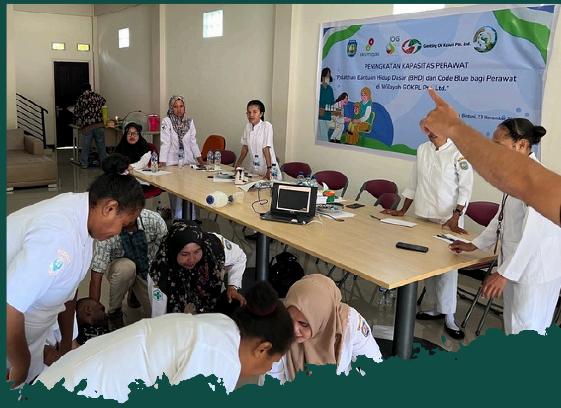
PROGRAM PELATIHAN BANTUAN HIDUP DASAR BAGI TENAGA KESEHATAN KERJASAMA SAPA FOUNDATION DAN GOKPL