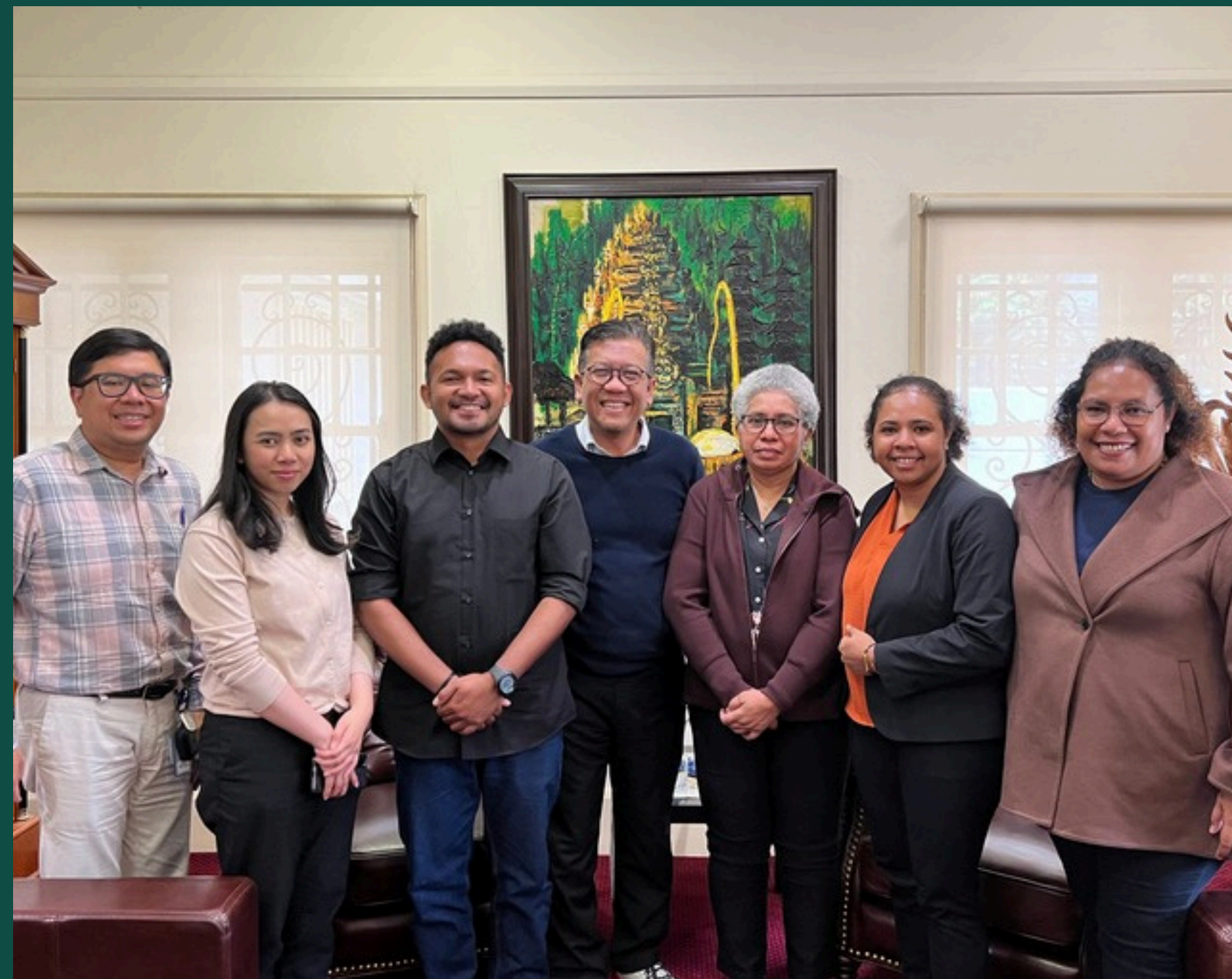
PROGRAM PENDAMPINGAN BEASISWA KE MONASH UNIVERSITY KERJASAMA SAPA FOUNDATION - BPSDM PROVINSI PAPUA 2022