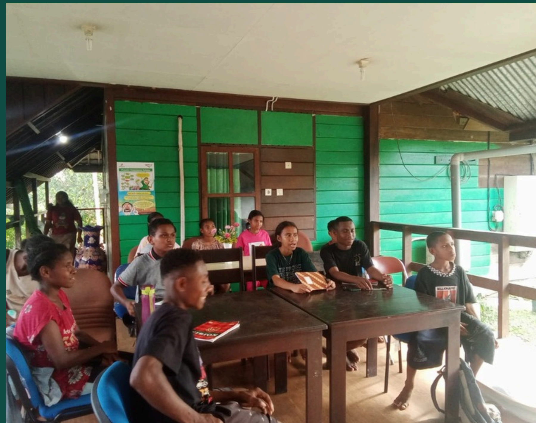
PROGRAM ENGLISH INTENSIVE COURSE DI TANAH MERAH BARU, TAROI, ARANDAI, WERIAGAR DAN KOKAS