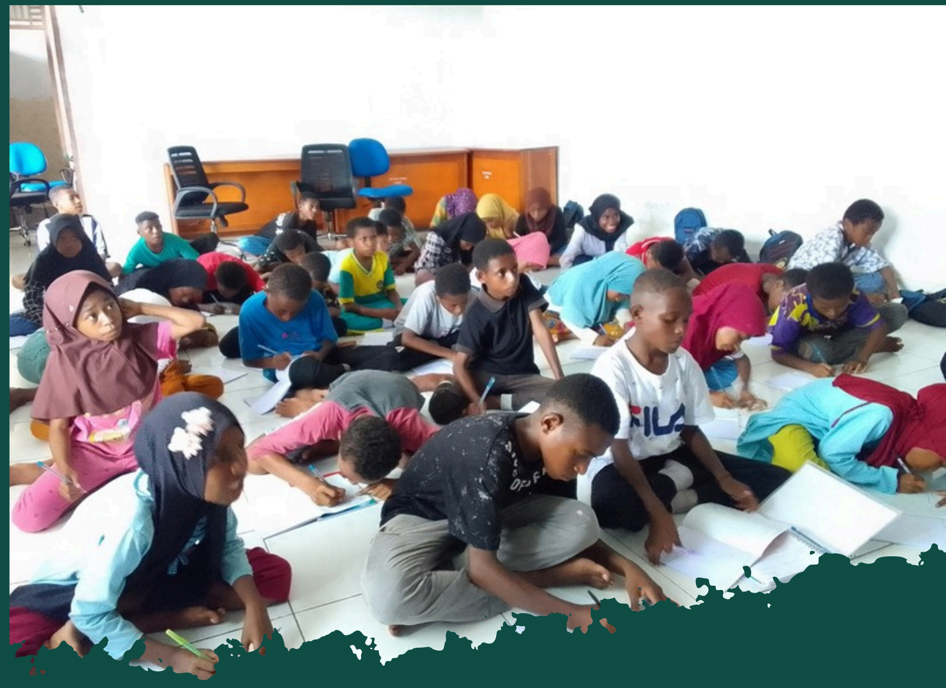
PROGRAM ENGLISH INTENSIVE COURSE DAN BOOTCAMP KERJASAMA SAPA FOUNDATION DAN BP-MIGAS 2024