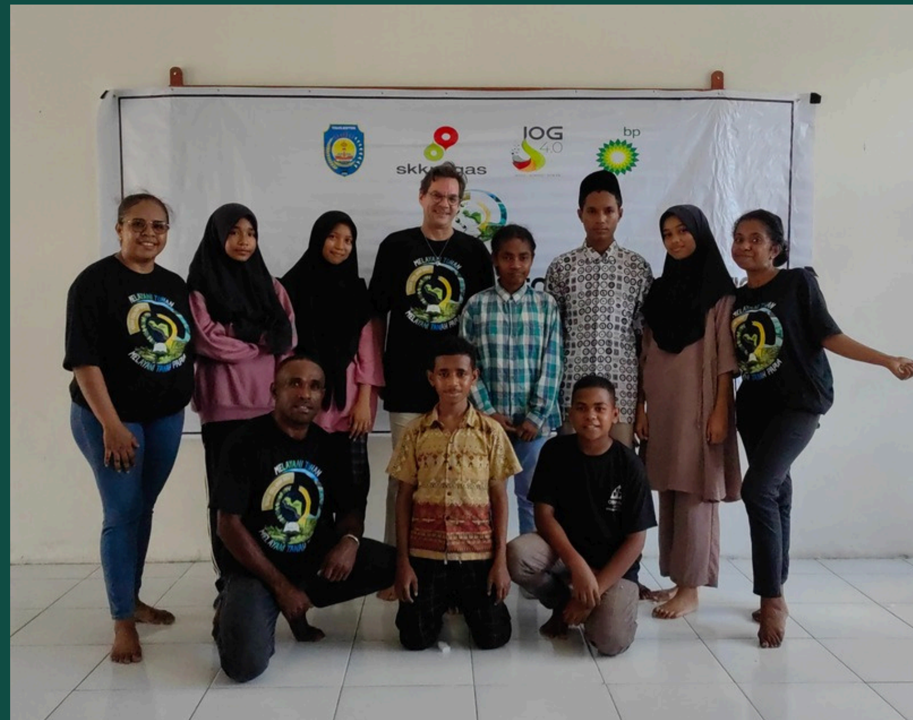
PROGRAM ENGLISH BOOTCAMP SISWA-SISWI TINGKAT SMP TANAH MERAH BARU, TAROI, ARANDAI, WERIAGAR DAN KOKAS