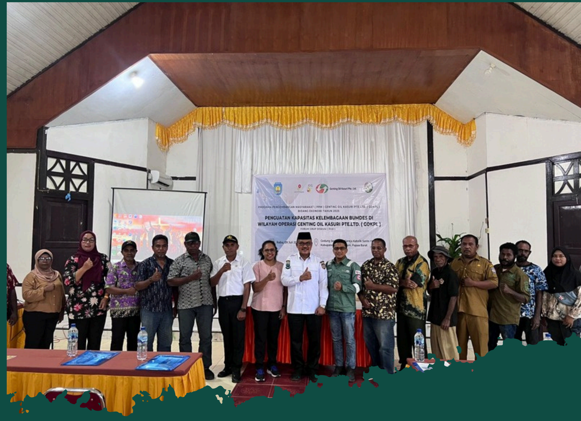
PROGRAM PEMETAAN SOSIAL DAN PENDAMPINGAN BUMDES PADA 12 KAMPUNG DI WILAYAH OPERASI GOKPL - KERJASAMA GOKPL DAN SAPA FOUNDATION