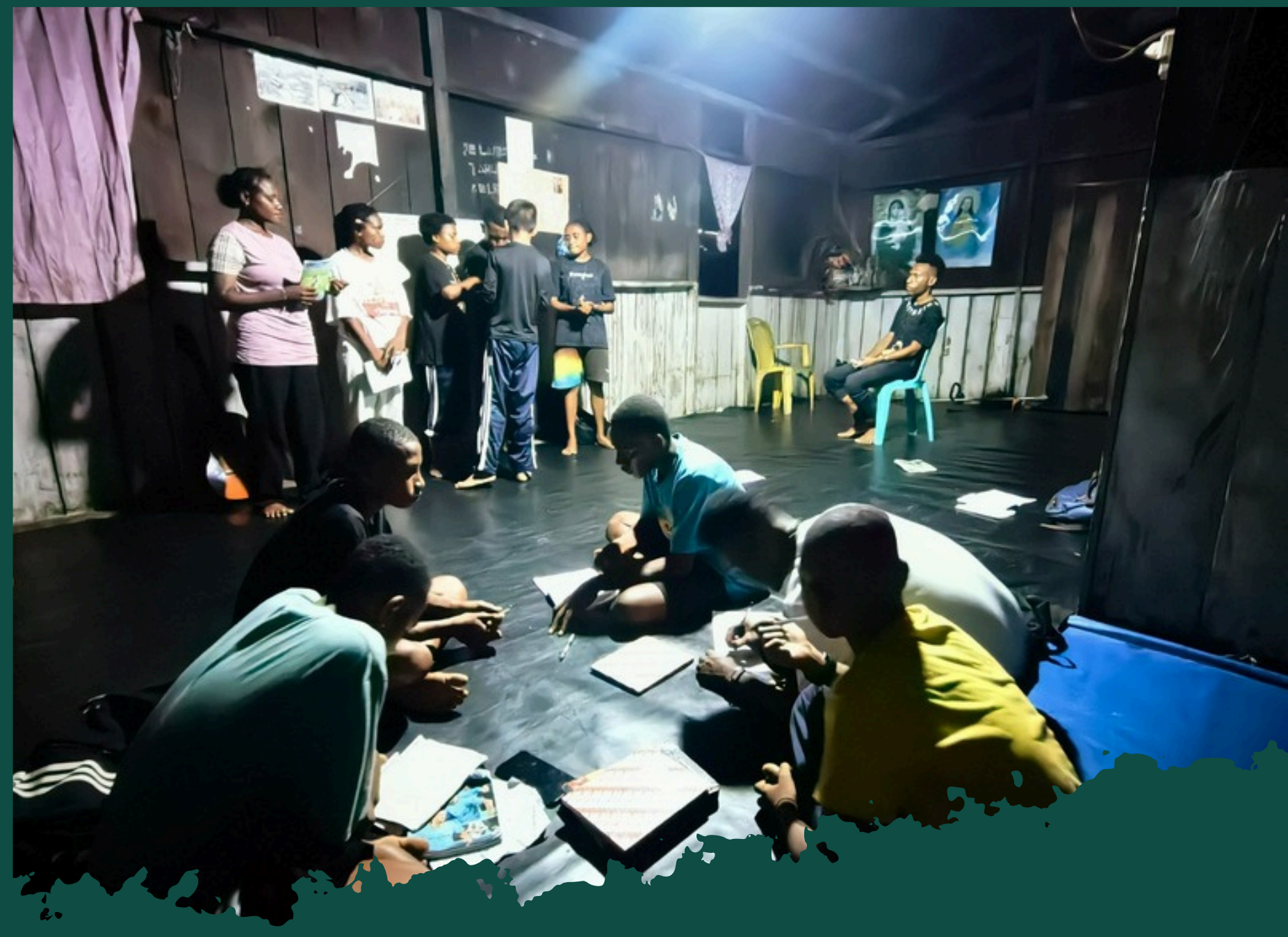
PROGRAM ENGLISH INTENSIVE COURSE DAN BOOTCAMP KERJASAMA SAPA FOUNDATION DAN BP-MIGAS 2024