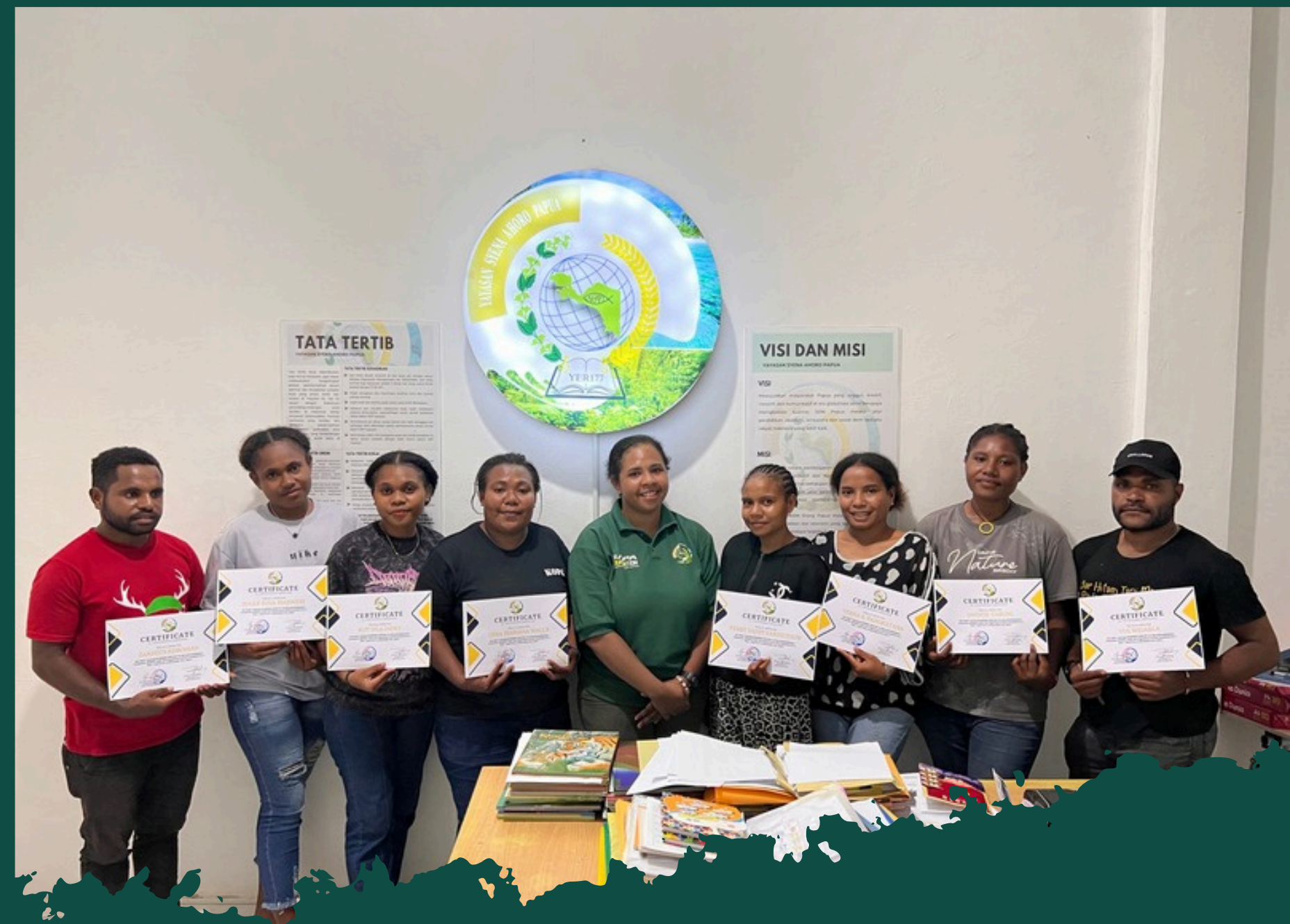
TRAINING PENGEMBANGAN UMKM MOORNING CREATIVE BAGI MAHASISWA STAKPN KAB. JAYAPURA 2024