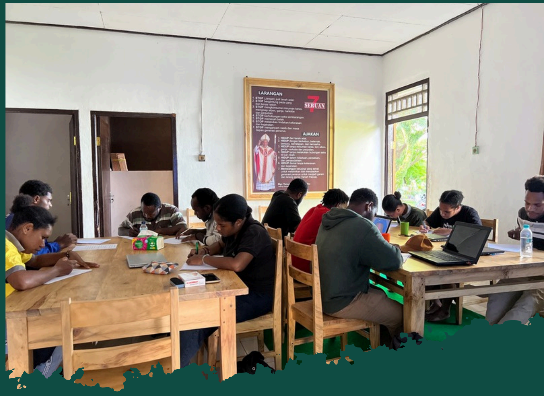
PROGRAM PENGUATAN LITERASI DIGITAL KERJASAMA SAPA FOUNDATION DAN YAYASAN YAWU PAPUA 2024