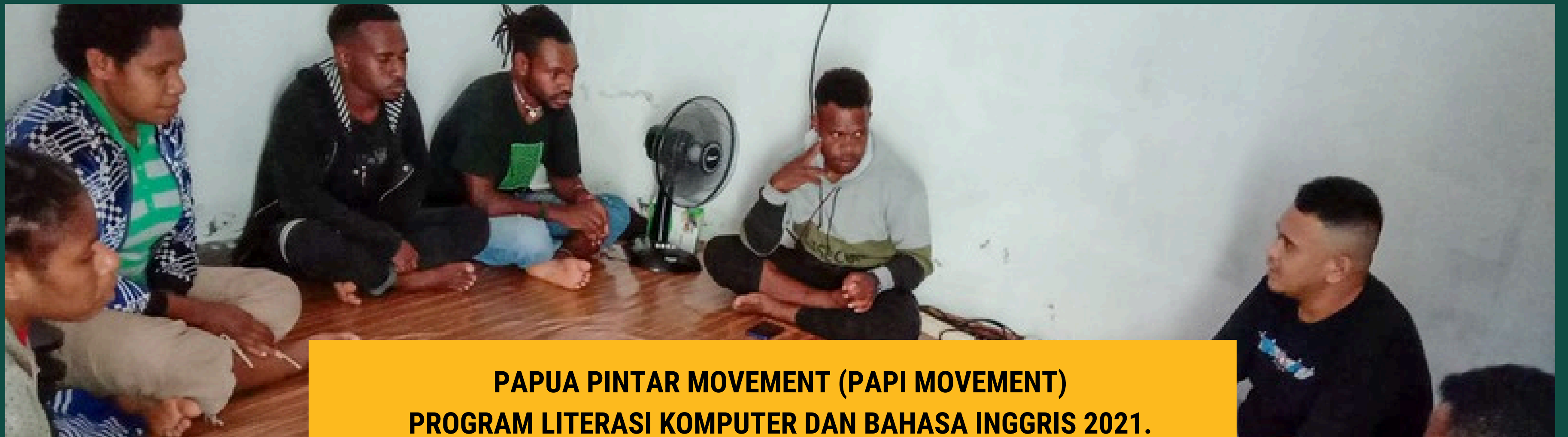
PAPUA PINTAR MOVEMENT (PAPI MOVEMENT) PROGRAM LITERASI KOMPUTER DAN BAHASA INGGRIS 2021.