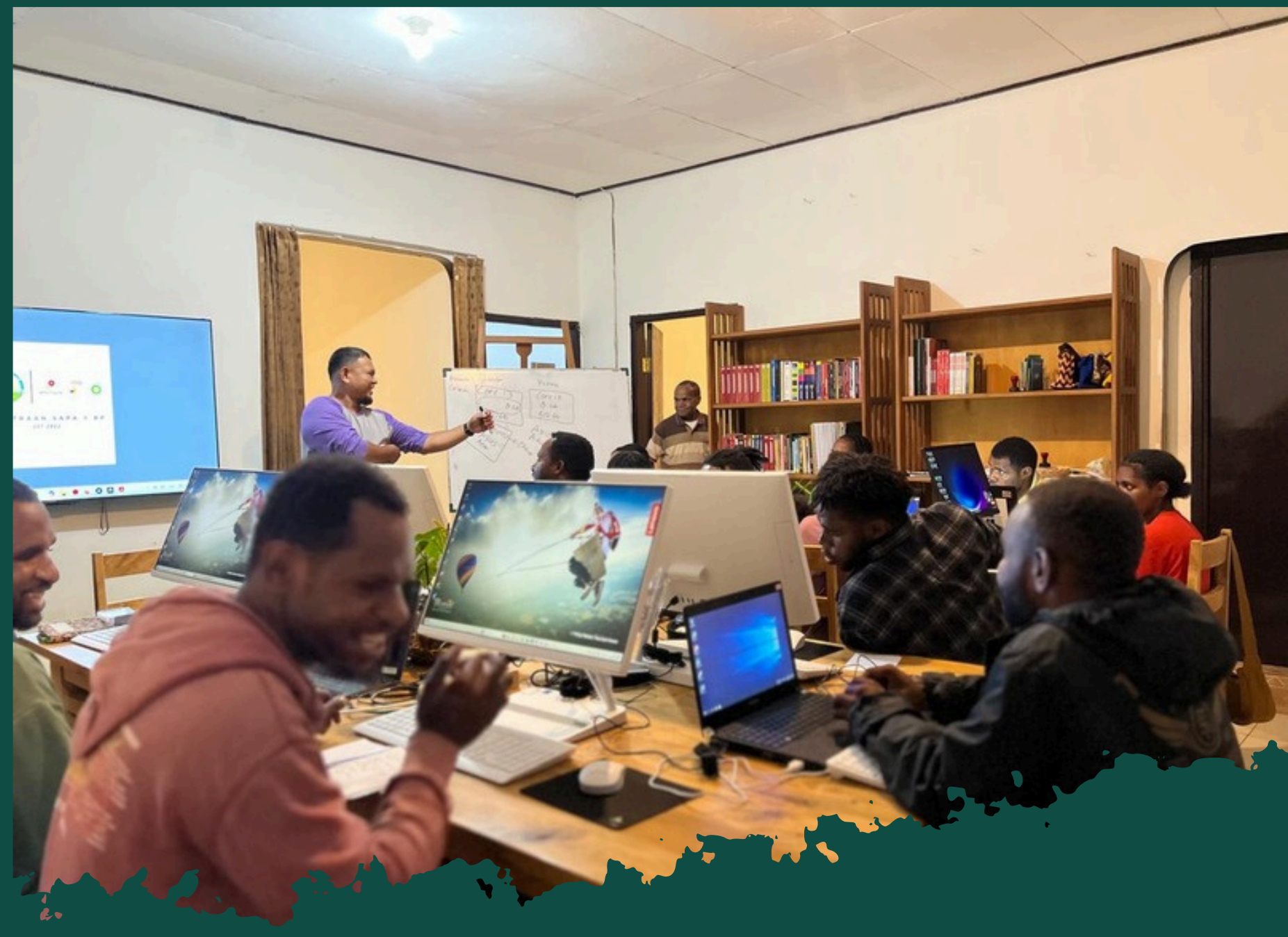
PELATIHAN KOMPUTER DASAR BAGI PEMUDA/PEMUDI HUBULA DI JAYAPURA MARET - JUNI (ANGKATAN KE-2). PROGRAM KOLABORASI SAPA FOUNDATION DAN YAWU PAPUA 2025