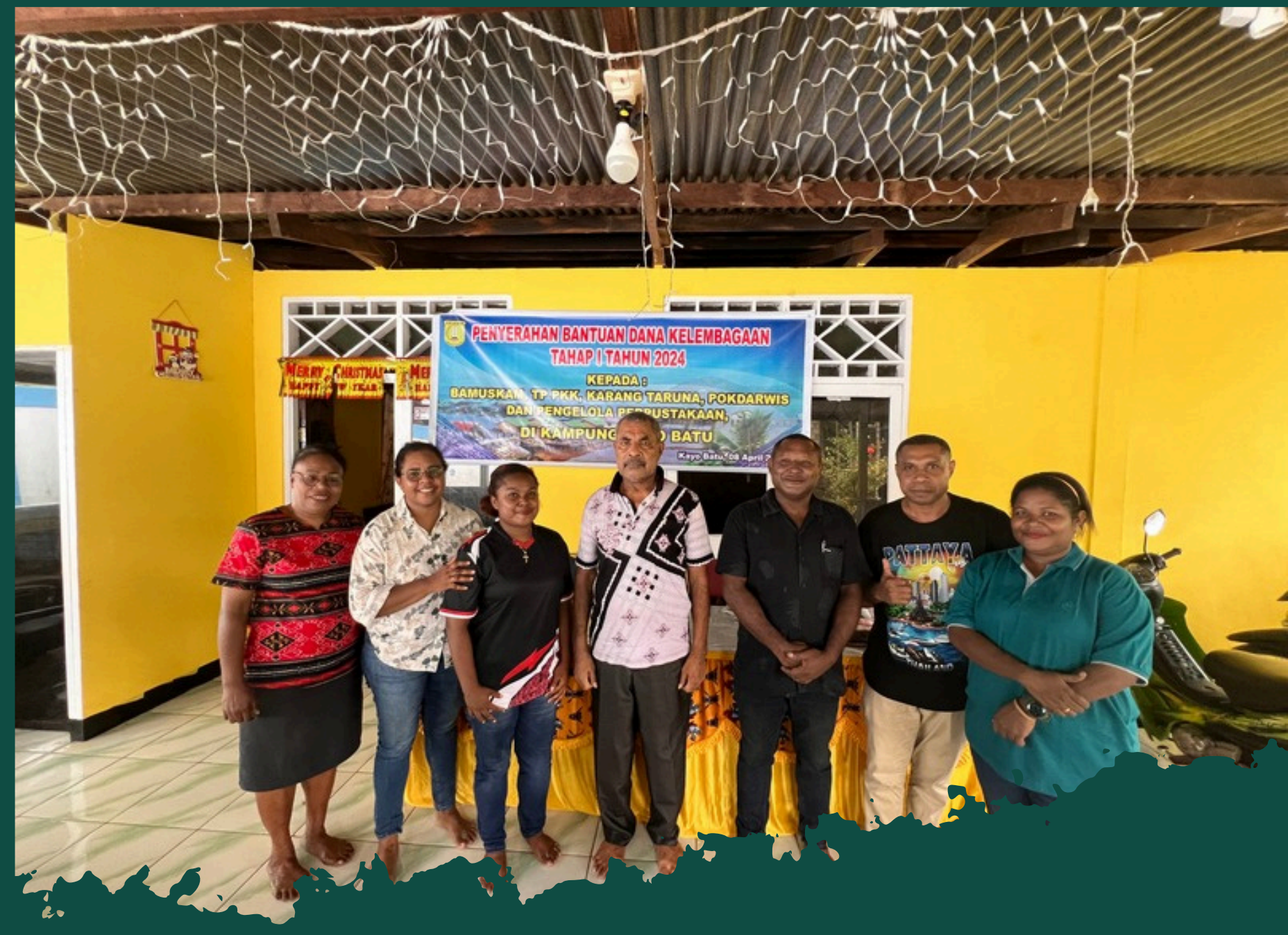
PROGRAM PENGUATAN LITERASI DAN PENDAMPINGAN PERPUSTAKAAN TAHUN DI KAMPUNG KAYOBATU 2024