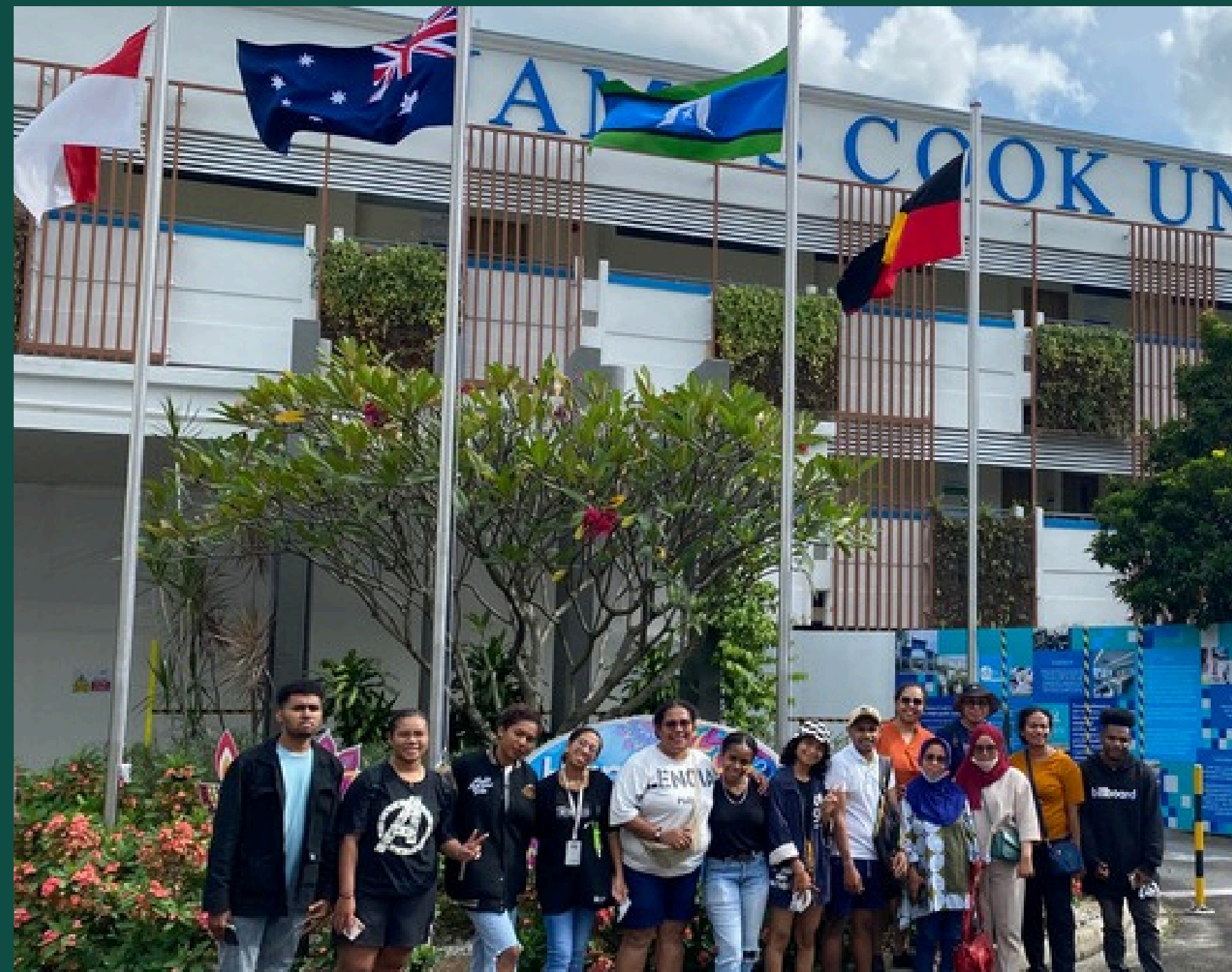
PROGRAM PENDAMPINGAN BEASISWA KE JAMES COOK UNIVERSITY SINGAPURA KERJASAMA SAPA FOUNDATION - BPSDM PROVINSI PAPUA 2022