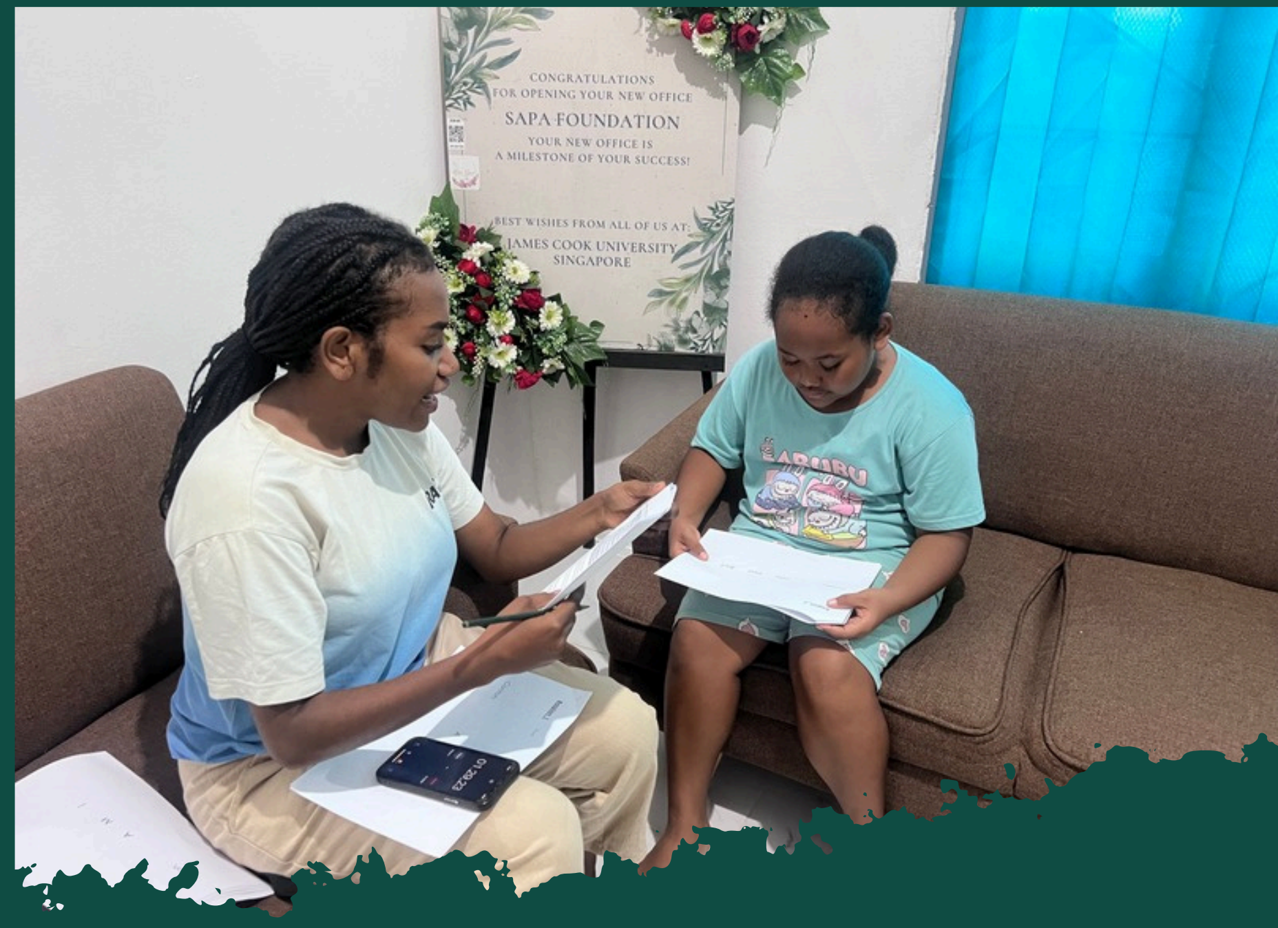
ASSESSMENT LITERASI NUMERASI BAGI SISWA - SISWI SD DI JAYAPURA UTARA. PROGRAM KOLABORASI SAPA FOUNDATION DAN YAWU PAPUA 2025