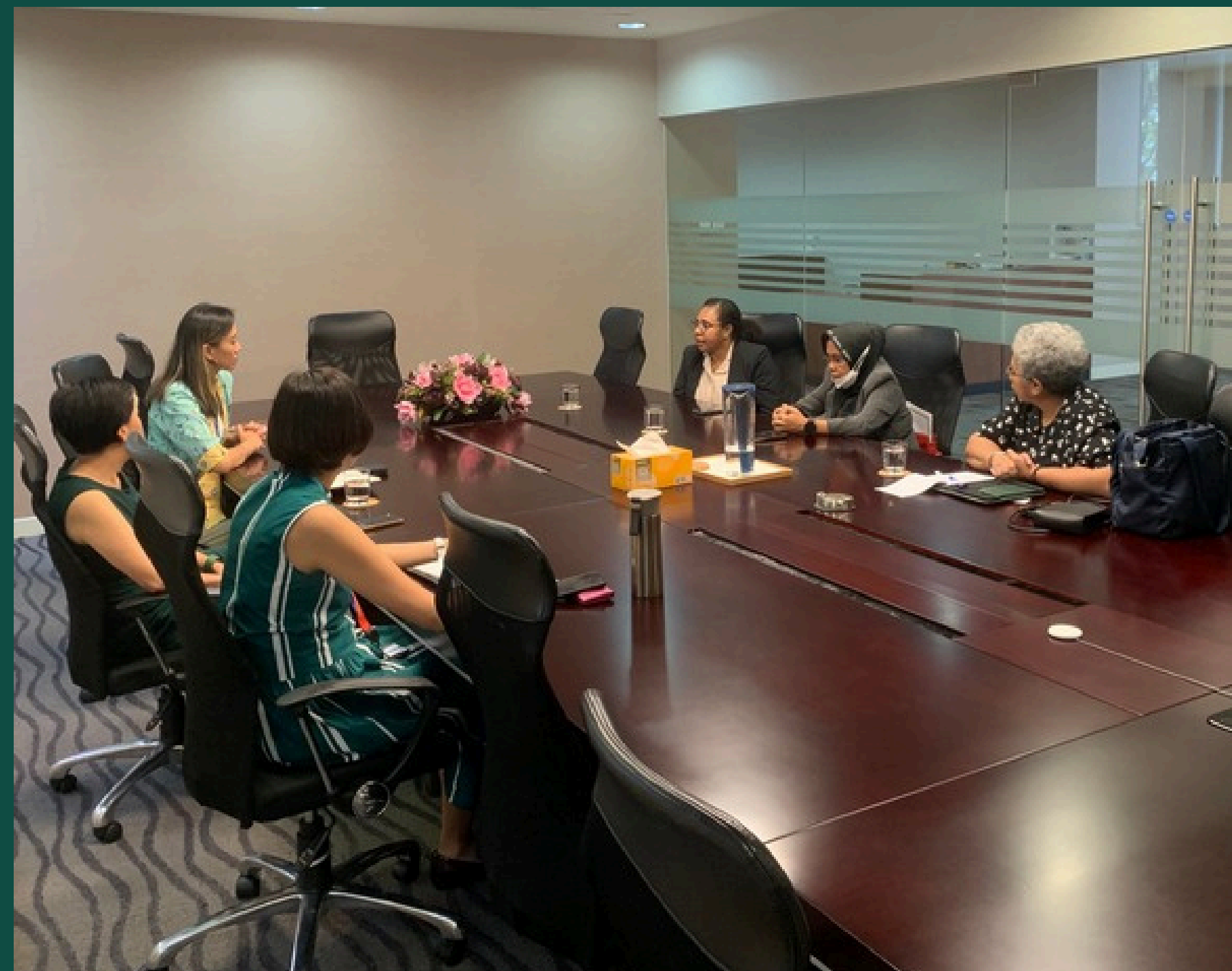
PROGRAM PENDAMPINGAN BEASISWA KE JAMES COOK UNIVERSITY SINGAPURA KERJASAMA SAPA FOUNDATION - BPSDM PROVINSI PAPUA 2022