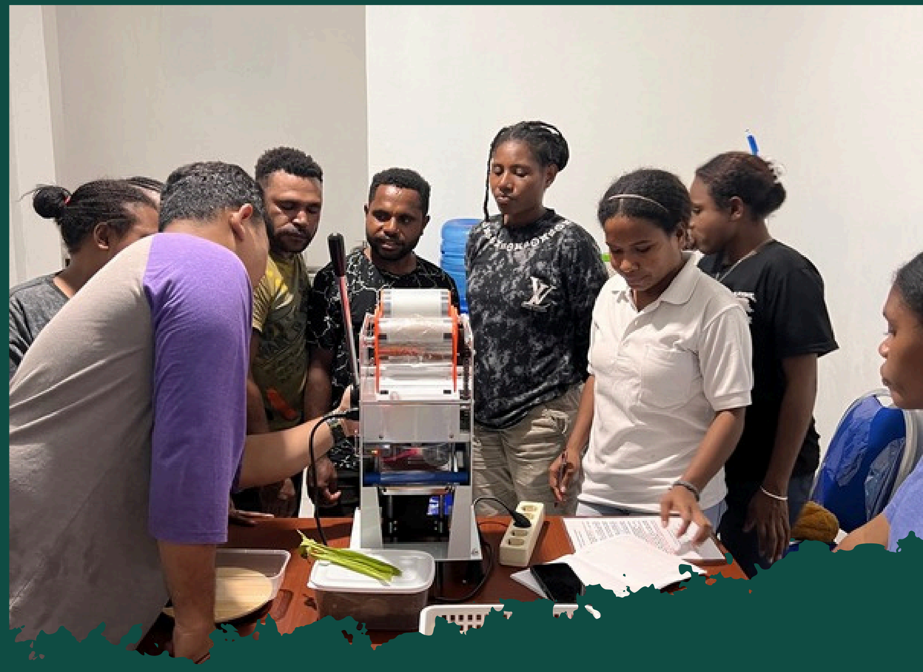
TRAINING PENGEMBANGAN UMKM MOORNING CREATIVE BAGI MAHASISWA STAKPN KAB. JAYAPURA 2024