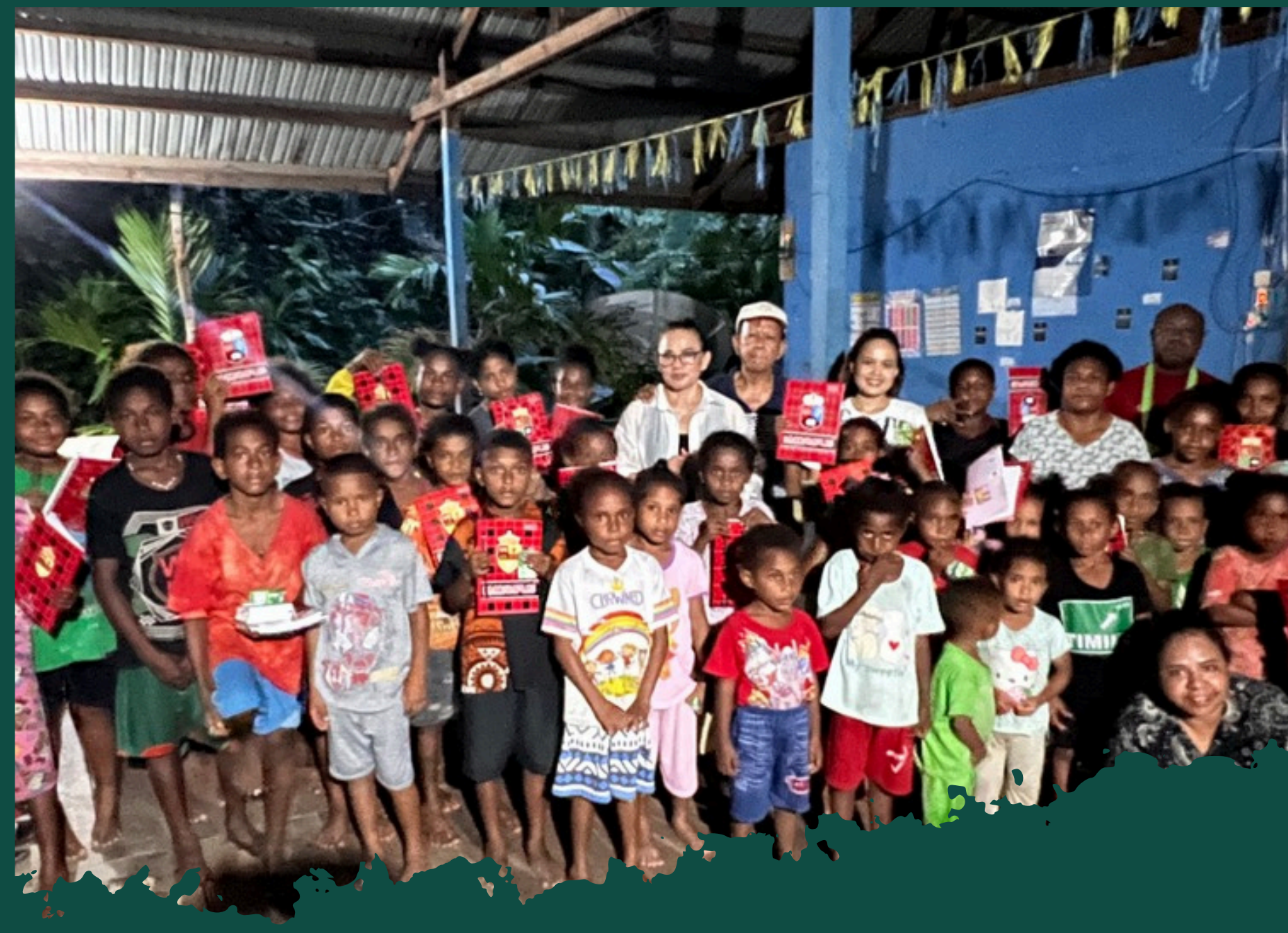
PROGRAM PAPUA PINTAR (PAPI) MOVEMENT DI KAMPUNG YEWENA DISTRIK DEPAPRE KABUPATEN JAYAPURA 2024